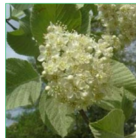
På billedet: Sorbus aria Akselrøn